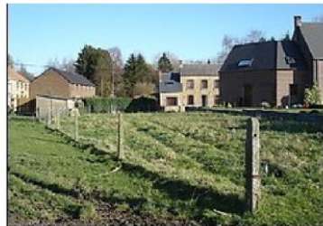
Chemin labouré, et de ce fait devenu impraticable.