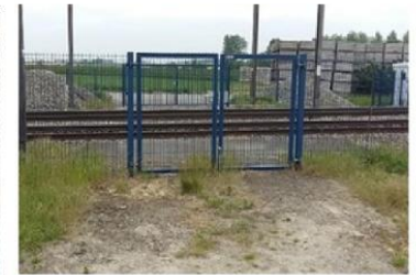
Le chemin n° 6 à Saint-Denis : le passage à niveau a été supprimé et barré.