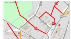
En rouge, les sentiers disparus dans le centre de Rhisnes.