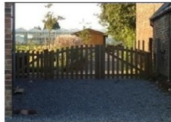
Chemin vicinal, et donc public, fermé par une barrière.